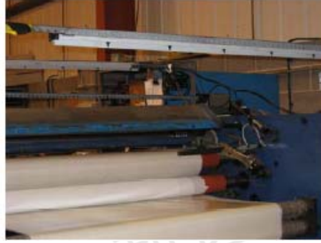
静电涂装、加工生产线