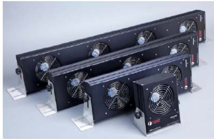
The 2050 Multi-fan Family