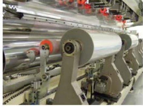
9m 宽高速运转的分切复卷机