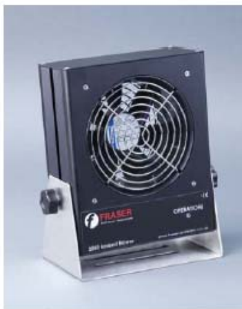
2050 - Single Fan

2050 系列 -结构紧凑，风扇数目分别为 1、2、3、4 四个选型。内置集成电源，钨发射器，风扇使用寿命长达 100,000 小时。