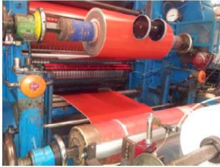
图示一个 Jupiter 同时中和两个卷绕机