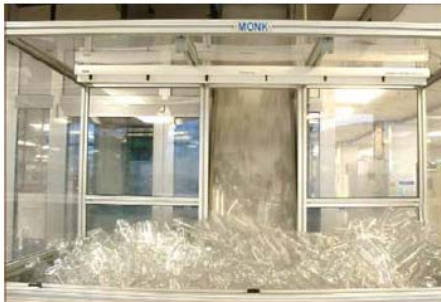
在填充线料斗中中和塑料瓶