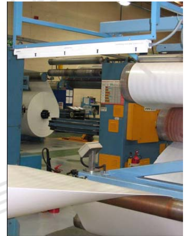
聚苯乙烯泡沫生产线